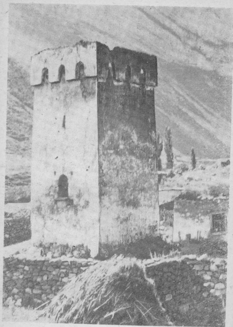
Боевая башня в Верхнем Чегеме.