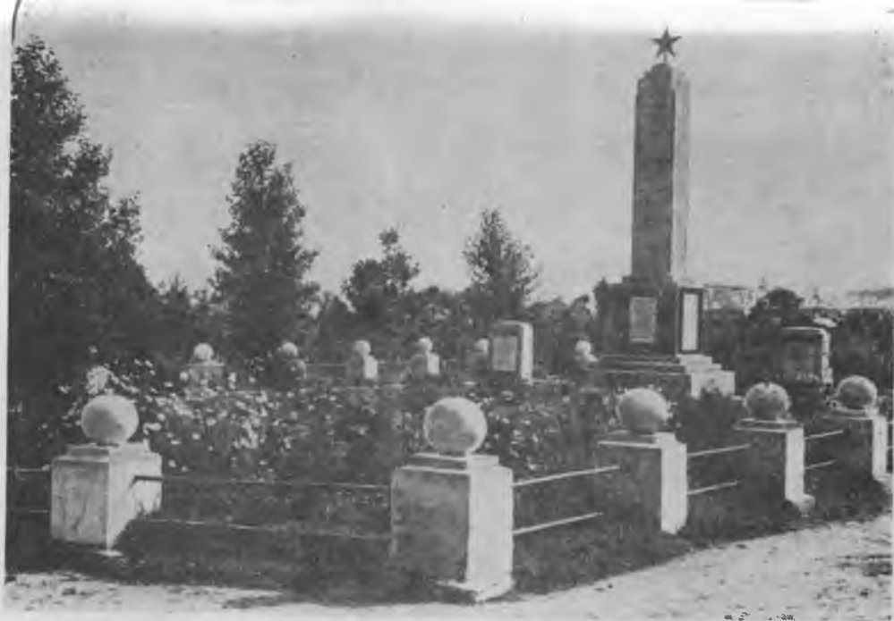
1941—45 джыллада. Уллу Атаджурт къазауатда Белоруссияны Могилев районунда ёлген партизанланы къарнаш къабырларындагы обелиск. Обелискни солджанында — Османны къабырыны сынташы. Могилев Ш. Лазаренко орам (алгынны Виленская).