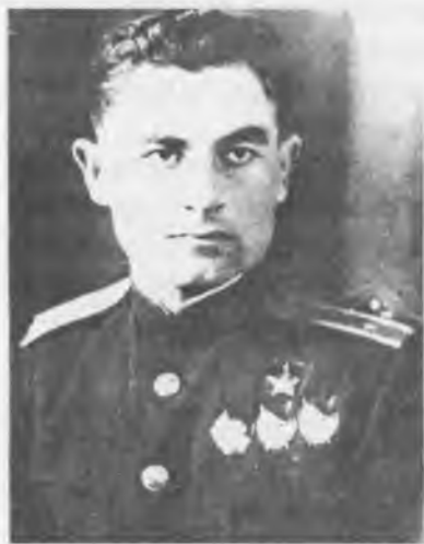
Герой Советского Союза Алим Байсултанов

Звание Героя Советского Союза было установлено Постановлением ЦИК СССР в апреле 1934 г., а в августе 1939 г. в целях особого отличия граждан, удостоенных звания Героя Советского Союза, была учреждена медаль «Золотая Звезда», имеющая форму пятиконечной звезды. Звание Героя Советского Союза было высшей степенью отличия и присваивалось за личные или коллективные заслуги перед Советским государством и обществом, связанные с совершением героического подвига.