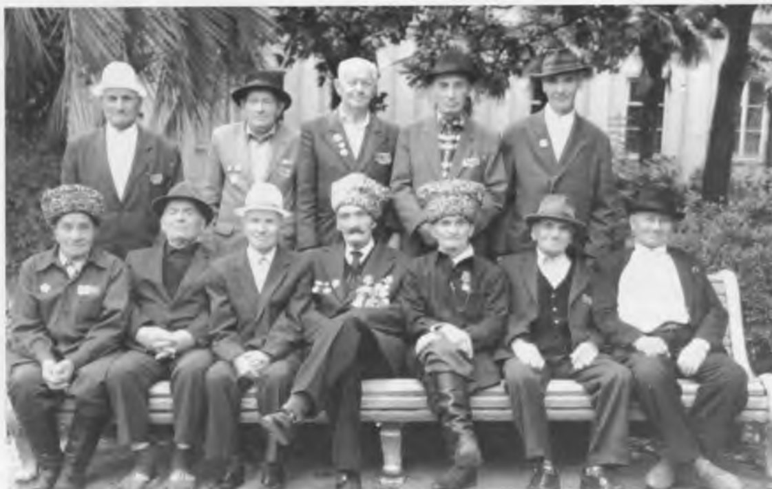
Ветераны Великой Отечественной войны из Ингушетии