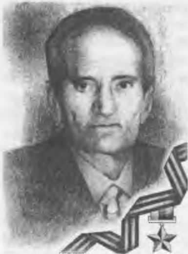
Герой России Х.И. Бадахов

Посланцы Карачаевской автономной области проявили массовый героизм, мужество и отвагу на всех фронтах Великой Отечественной войны. За совершенные боевые подвиги тысячи из них были награждены боевыми орденами и медалями. Лучшие из лучших были удостоены высших государственных наград и званий Героя Советского Союза и Героя Российской Федерации.