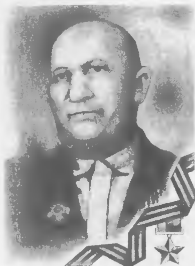
Герой России А.М. Ижаев

ЯК-9 он произвел 102 боевых вылета с налетом 91 час, провел 39 воздушных боев, лично сбил 15 вражеских самолетов. Д.Н. Голаев был посмертно представлен к награждению орденом