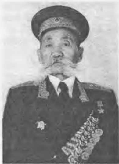
Герой Советского Союза О.И. Городовиков

Генерал-полковник Ока Городовиков – бывший заместитель командующего кавалерией РККА был награжден высшей наградой страны по совокупности всех своих воинских заслуг, включая свою деятельность в период Великой Отечественной войны.