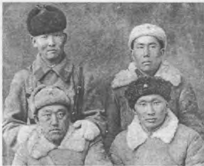
Бойцы 110 ОККД