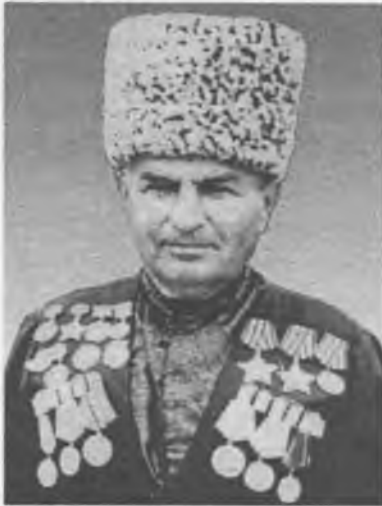
Канта Абдурахманов, Герой России

Имя Канта Абдурахманова, добровольцем ушедшего в Красную Армию, стало известно в связи с его подвигами во время войны. Когда началась война, он учился на артиллериста. Полк, в котором служил К. Абдурахманов, был дислоцирован недалеко от Сталинграда. Канта писал заявления с просьбой отправить его на фронт. В 1942 г. его направили в 51-ю гвардейскую дивизию 6-й гвардейской армии и назначили командиром орудия. Вехи его воинского пути – Таллин, Рига, Полоцк, Витебск. Войну закончил в Польше в 1945 г.