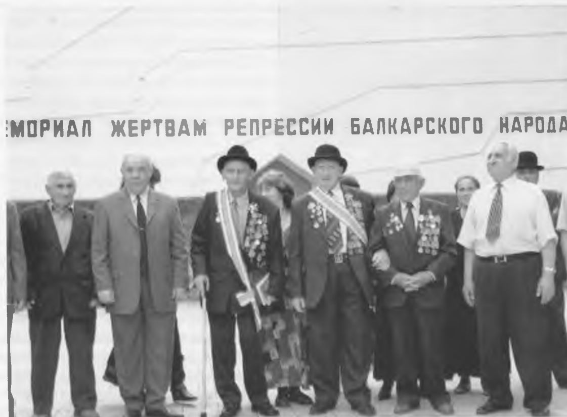
Ветераны войны Кабардино-Балкарии у Мемориала жертвам репрессии балкарского народа