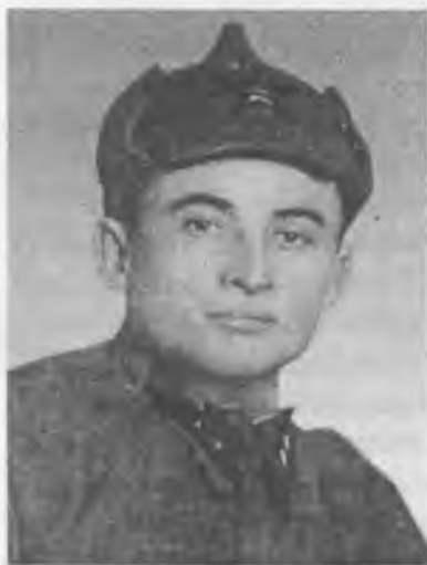
Магомед Узуев, Герой России

В связи с депортацией чеченского народа 23 февраля 1944 г. сотням чеченцев, представленным к высоким наградам и званию Героя Советского Союза, было в этом отказано.