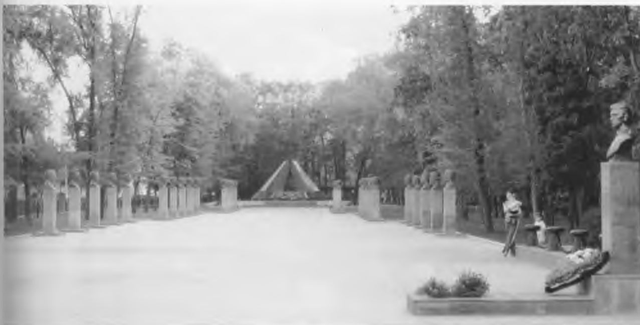
Мемориальный комплекс (г. Черкесск, Карачаево-Черкесская Республика)