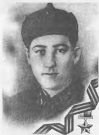
Герой России Ю.К. Каракетов

отделения разведки. По характеру и количеству совершенных подвигов он заслуживал присвоение звания Героя Советского Союза. Справедливость восторжествовала, но только спустя 50 лет. Указом Президента РФ № 1018 от 5 октября 1995 г. А.М. Ижаеву было присвоено звание Героя Российской Федерации посмертно. Он умер в 1994 г., не дожив один год до радостного события.