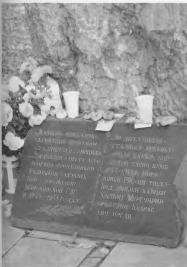
Камень в память о воинах-калмыках, снятых с фронта в 1944 г. и отправленных в один из лагерей ГУЛАГа на строительство Широковской ГЭС в Пермской области (г. Элиста, Республика Калмыкия)