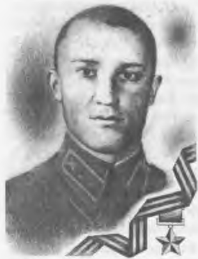
Герой Советского Союза О.М. Касаев

121-й партизанский полк наводил большой страх на фашистских оккупантов, которые организовали против него 5 карательных экспедиций, но все они были безуспешны. Комендант