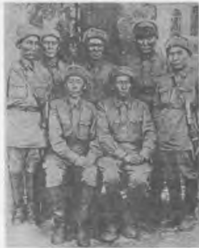
Бойцы 189-го Калмыцкого кавполка 70 кд