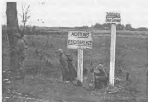
Части 184-й сд под командованием Б.Б. Городовикова переходят Государственную границу СССР (1944 г.)

В начале операции “Багратион” это соединение успешно выполнило задачу по окружению и разгрому Витебской группировки противника. На завершающем этапе городовиковцы отразили все атаки 206-й пехотной дивизии Хиттера. Более 3 тыс. немецких солдат сдались на поле боя.