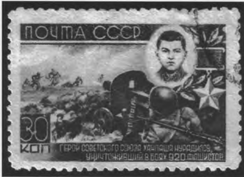
Почтовая марка 1944 г., посвященная Герою Советского Союза Х. Нурадилову