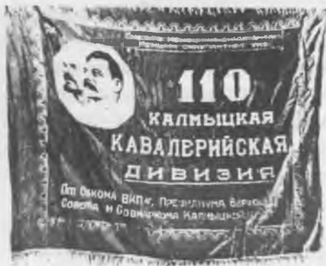
Боевое знамя 110 ОКВД

12 июля 110-ю ОКВД передали в состав 51-й армии и выдвинули на оборонительные позиции на южном берегу Дона между станицами Багаевская и Семикаракорская (58 км вместо положенных по уставу 4 – 6 км). Левее – на рубеже Манычская – Ольгинская развернулась 115-я Кабардино-Балкарская кавдивизия, но позже ее сменила 156-я сд. В полосе 110-й ОКВД работало две переправы, и в планах сторон данный участок считался очень важным. Об этом говорит такой факт, только к исходу дня 15 июля в полосе обороны дивизии переправились части 318-й, 335-й и 244-й стрелковых дивизий и свыше 1000 автомашин 83 .